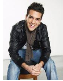
Elyas M'Barek Sinan