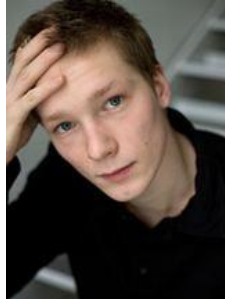
Jacob Matschenz Dennis