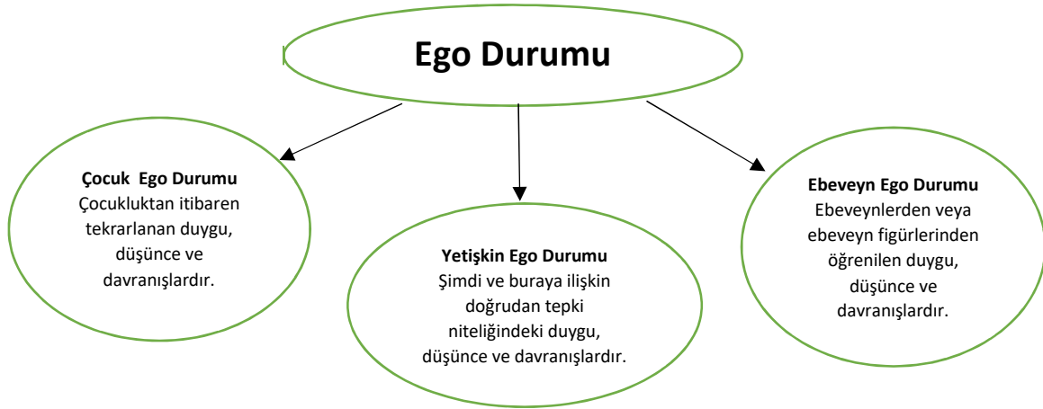
Şekil 2. Transaksiyonel analizde ego durumları (Businessballs, t.y.)