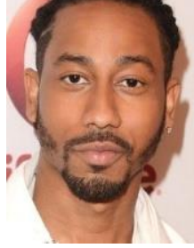
Brandon T. Jackson