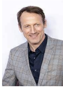
Wotan Wilke Möhring