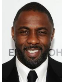
Idris Elba – Tilki