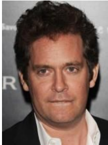
Tom Hollander – Köstebek