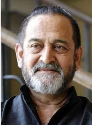
Mahesh Manjrekar (The Stork)