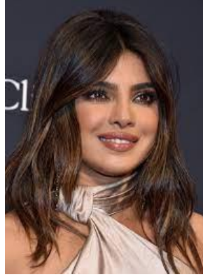
Priyanka Chopra (Pinky Madam)