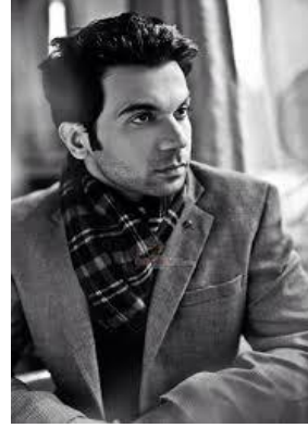
Rajkummar Rao (Ashok Bey)