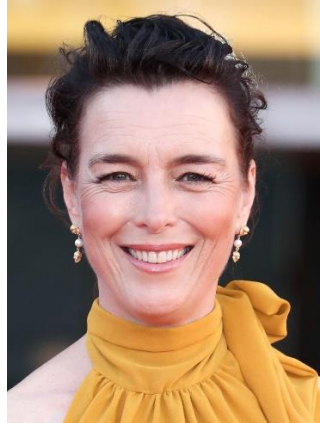
Olivia Williams Rolü: Catherine