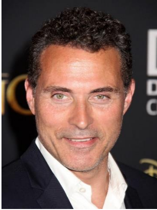
Rufus Sewell Rolü: Paul