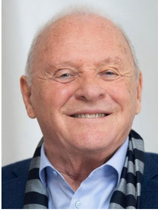
Anthony Hopkins Rolü: Anthony