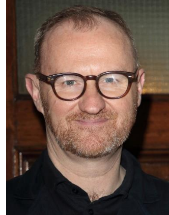
Mark Gattis Rolü: Bill