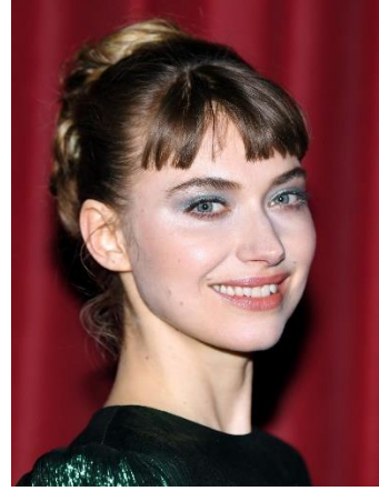
Imogen Poots Rolü: Laura