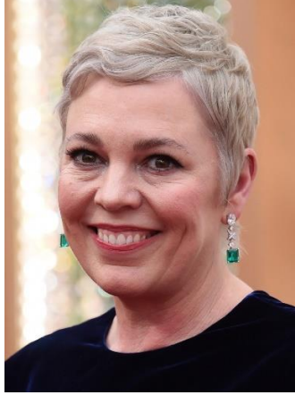
Olivia Colman Rolü: Anne