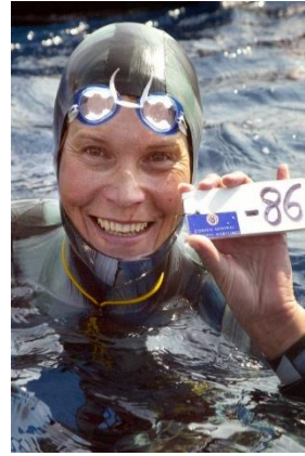
Natalia MOLCHANOVA Serbest Dalıcı