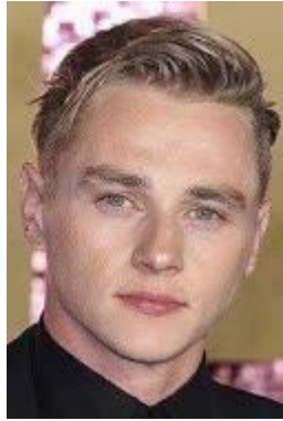
Ben Hardy (Roger Taylor)