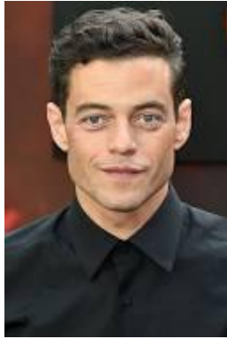
Rami Malek (Freddie Mercury)