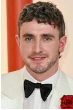
Calum (baba) Paul Mescal