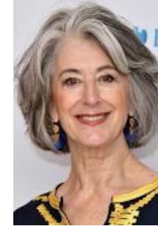
Maureen Lipman Anne