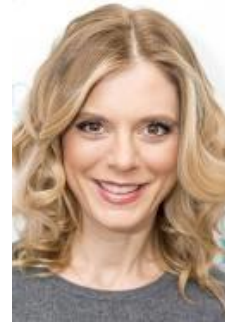
Emilia Fox Dorota