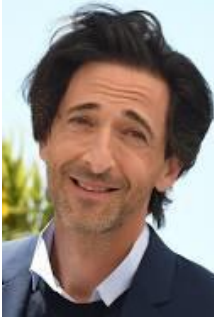
Andrien Brody Wladyslaw Szpilman