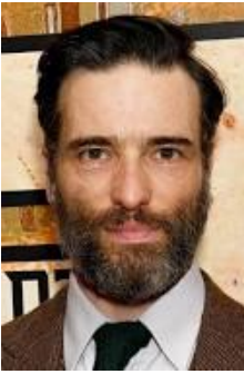
Ed Stoppard Henryk