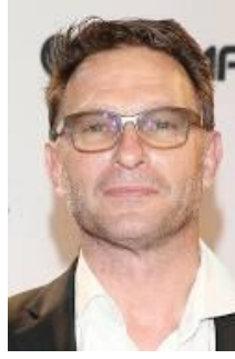
Thomas Kretschmann Yüzbaşı