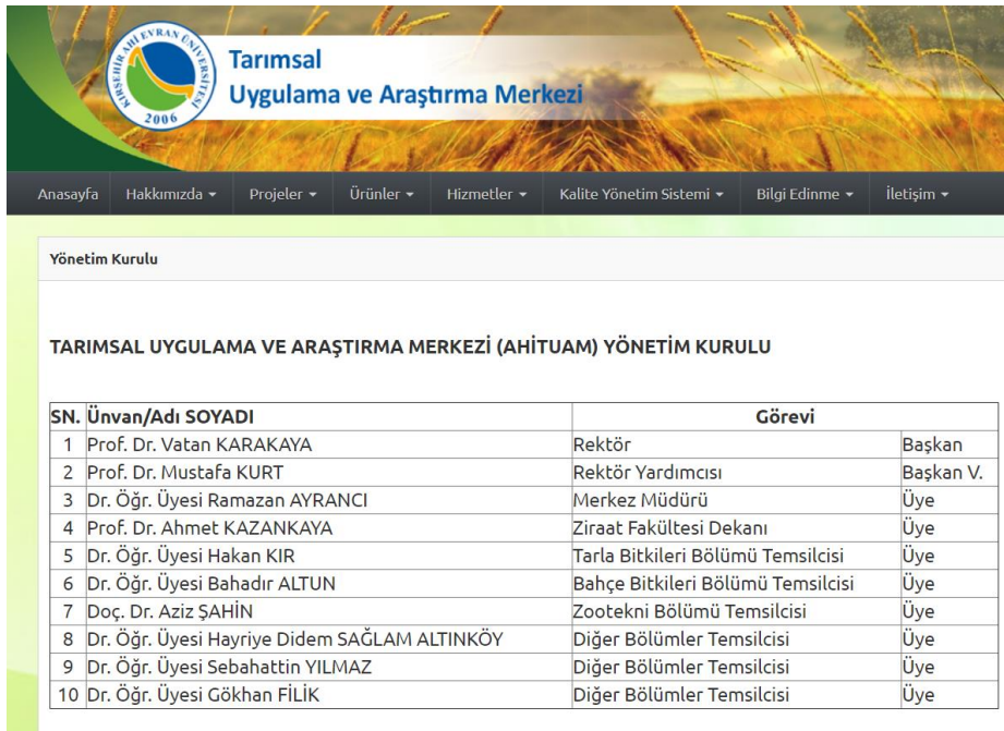
Şekil 2. Tarımsal Uygulama ve Araştırma Merkezi Yönetim Kurulu

Birimimizde çalışmaların düzgün bir şekilde yürütülebilmesi için birim yönetim kurulu mevcuttur (Şekil 2). Bunun yanında Müdür, müdür yardımcıları, sekreteryaya ve tam zamanlı işçilerle çalışmalar yürütülmektedir.